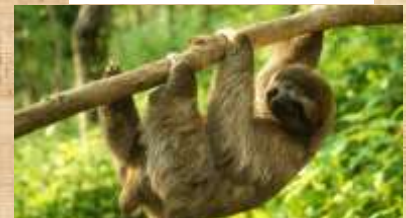
Paresseux dans la nature