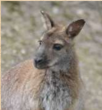
Wallaby : destruction de l'habitat par la mise en place d'élevage de mouton