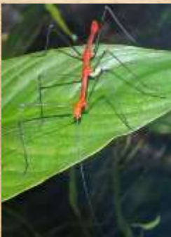
Phasme du Pérou