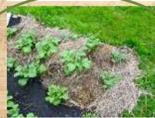
Fumier. Engrais naturel