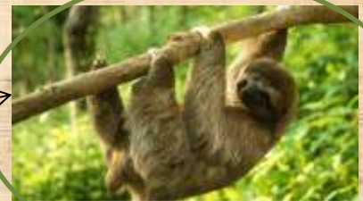
Paresseux dans la nature