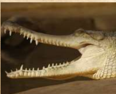
Crocodile : Chassé pour sa viande et sa peau