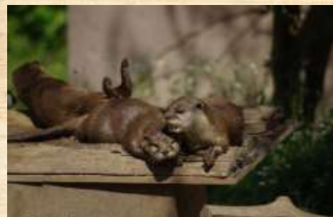
Loutres : Population de poissons qui diminue