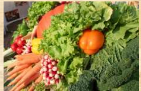
Un jardin de légume