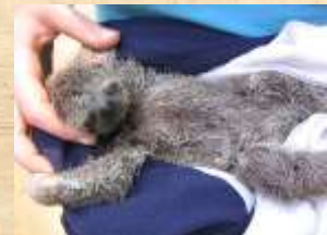
Paresseux avec humain