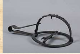
Piège à animaux