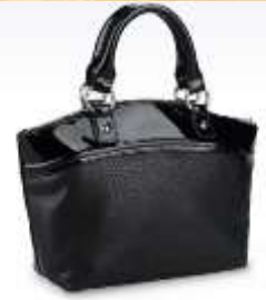
Sac à main en synthétique