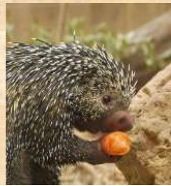
Coendou : Déforestation par la mise en place de champs de soja