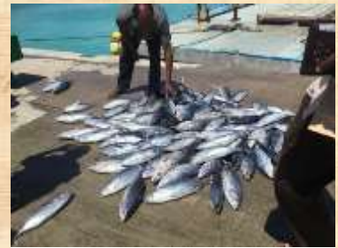
La surpêche des poissons