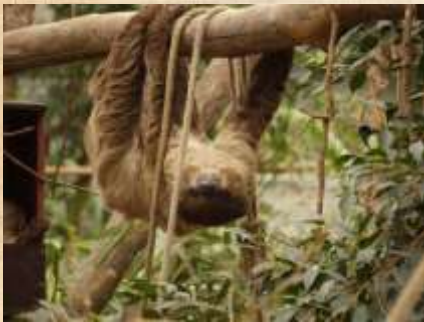
Paresseux : Utilisation de jeune paresseux pour faire des selfies avec les touristes