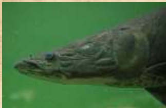
Arapaïma : Déchet jetés dans la nature, nous tuons les poissons