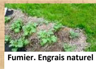
Fumier. Engrais naturel