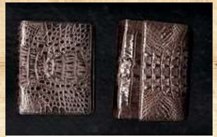
Porte-monnaie en peau de serpent