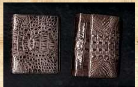
Porte-monnaie en peau de serpent