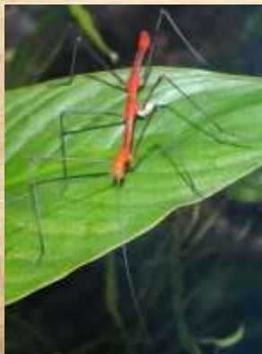
Phasme : Utilisation de pesticides sur les insectes pour qu'ils ne mangent pas les plantes