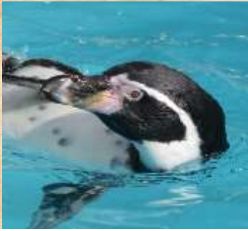
Manchot : Avec l'augmentation des températures, les poissons se déplacent ce qui limite la nourriture des manchots