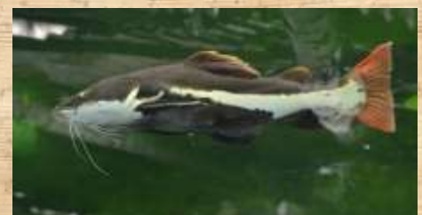
Silure à queue Rouge : Ce poisson est surpêché pour la consommation