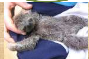
Paresseux avec humain