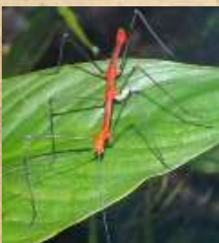
Phasme du Pérou