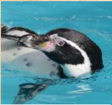
Manchot de Humbolt