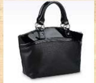
Sac à main en synthétique