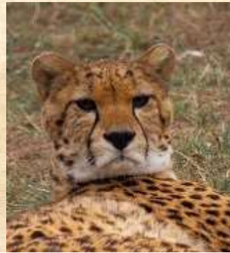
Guépard : Utilisation pour faire des selfies avec les touristes