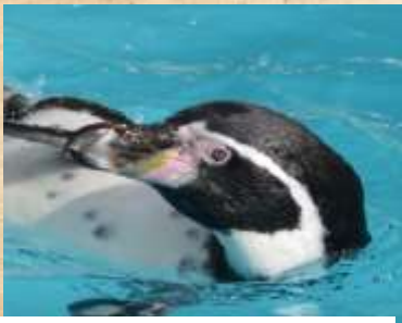
Manchot de Humbolt