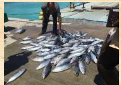
La surpêche des poissons